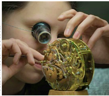
MUSÉE D'HORLOGERIE DU LOCLE